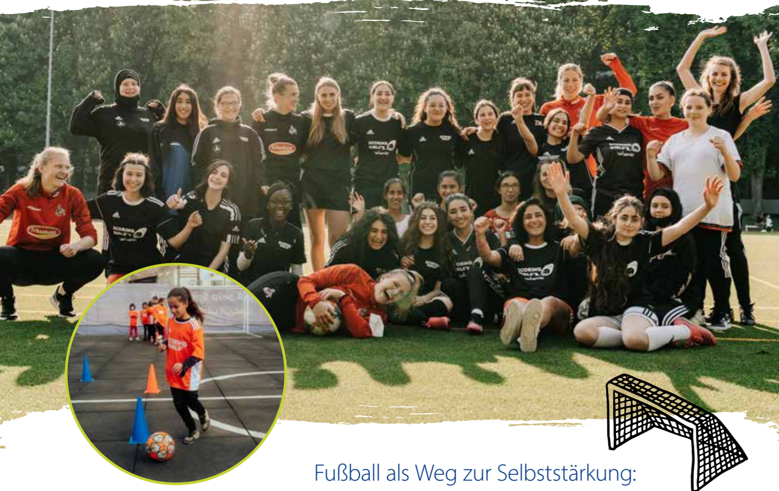
Fußball als Weg zur Selbststärkung: